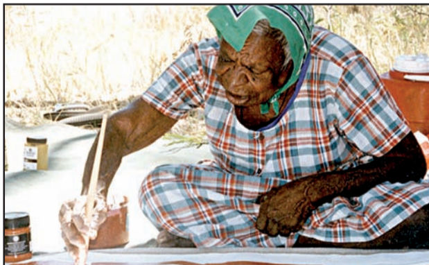
Telas de Emily Kane Kngwarreye, artista já falecida e que começou a pintar aos 80 anos: obras no MoMa