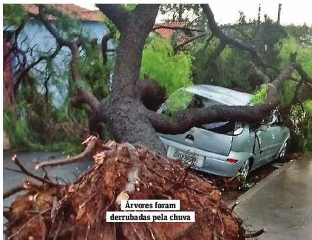
Árvores foram derrubadas pela chuva

A chuva forte que chegou a Campinas no início da tarde de ontem e durou cerca de 40 minutos deixou um rastro de alagamentos e destruição em alguns pontos da cidade. Segundo a medição do Cepagri (Centro de Pesquisas Meteorológicas e Climáticas Aplicadas à Agricultura) da Unicamp , os ventos chegaram a 76,6 km/h