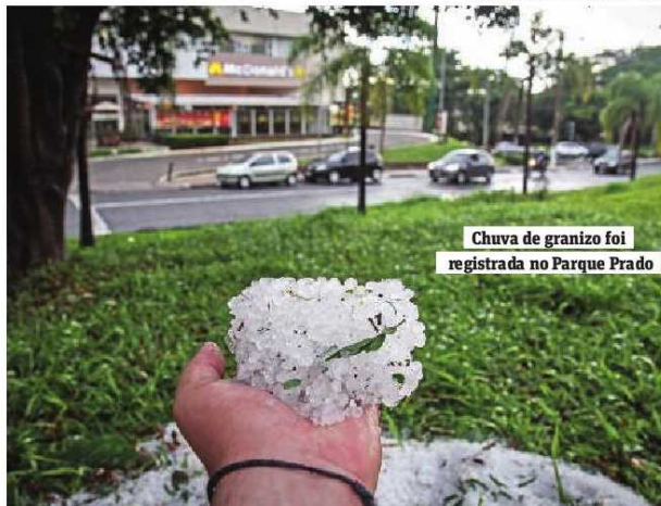
Chuva de granizo foi registrada no Parque Prado