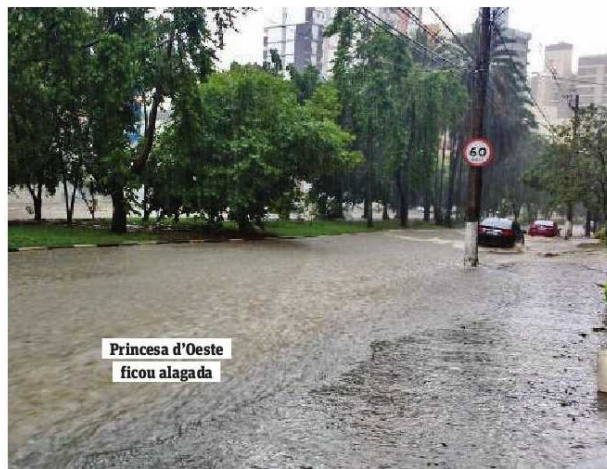
Princesa d'Oeste ficou alagada