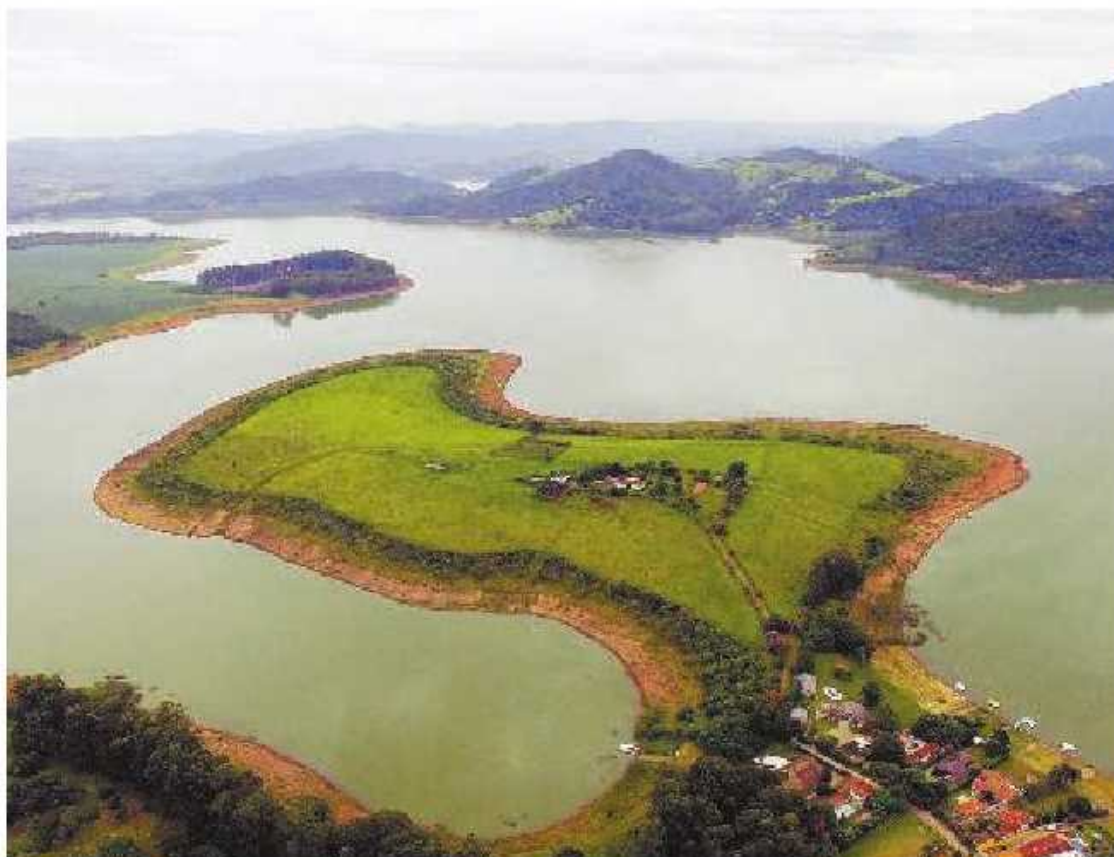
Vista aérea da represa do Jaguari, em Bragança