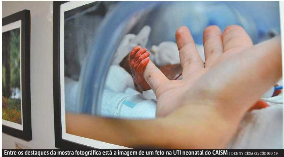
Entre os destaques da mostra fotográfica está a imagem de um feto na UTI neonatal do CAISM

“Para mim, um destaque é a foto com a qual concorremos no prêmio FEAC, da UTI neonatal de um be-