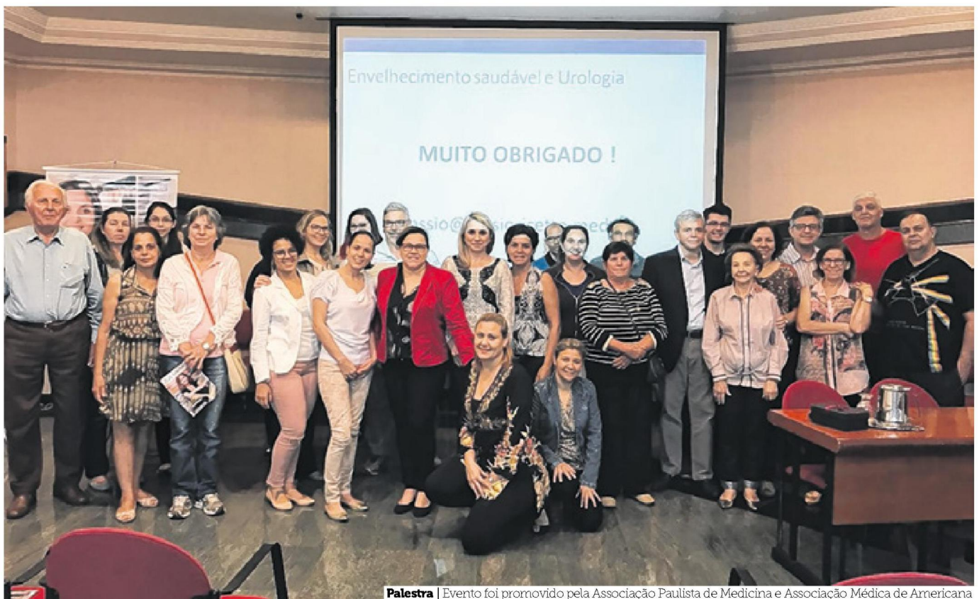
Palestra | Evento foi promovido pela Associação Paulista de Medicina e Associação Médica de Americana

O médico ressaltou que o aumento da expectativa e da qualidade de vida tornou os aspectos da vida sexual relevantes para parcela crescente dos idosos. “Nesse sentido, seja para homens como para mulheres, existem terapias que podem ser propostas visando tornar as experiências sexuais dos casais idosos plena e prazerosa”, informou. “Vivemos num mundo em envelhecimento. Dessa forma, é dever da sociedade preparar-se para atender de forma satisfatória as novas expectativas e demandas dos idosos do terceiro milênio”, disse o médico.