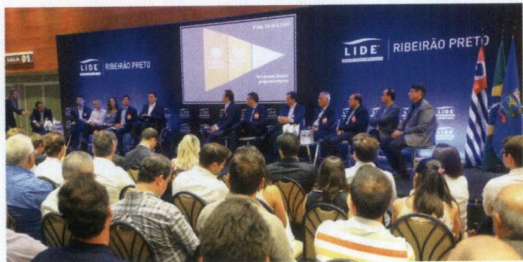
Fundos patrimoniais são tema do LIDE Ribeirão Preto