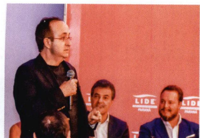
Reinaldo Azevedo quer culpados na cadeia

Convidado pelo presidente do LIDE Paraná , Fabrício de Macedo, o jornalista Reinaldo Azevedo falou sobre a Defesa do Estado de Direito a autoridades de Curitiba. Para Azevedo, sem Estado de Direito só resta o arbítrio. “Quero que a Lava Jato continue, que os culpados vão para a cadeia. Mas não podemos conduzir o País à descrença nas instituições. Se a Constituição tivesse sido respeitada, talvez o País não estivesse na situação em que se encontra”, afirmou.