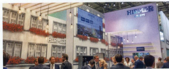
Munique é sede da Expo Real, feira mundial de imóveis

O LIDE Alemanha , por meio do LIDE Mulher , realizou o evento Networking at the Oktoberfest , em Munique. Empresárias da região da Baviera estiveram na tradicional festa da cidade, para trocar experiências e conversar sobre projetos entre Brasil e Alemanha – país que tem um número significativo de mulheres em cargos gerenciais. Na mesma cidade, o LIDE Alemanha foi representado por seu presidente Christian Hirmer, na Expo Real, maior feira imobiliária do mundo. O Hirmer Gruppe administra 120 mil m 2 de imóveis em toda a Alemanha.