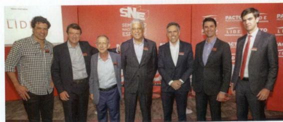
Transparência e governança foram temas do Seminário Nacional do Esporte