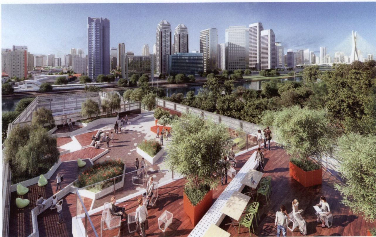
Projeto da Avenues de São Paulo, a primeira fora dos Estados Unidos, que deve entrar em operação no segundo semestre de 2018