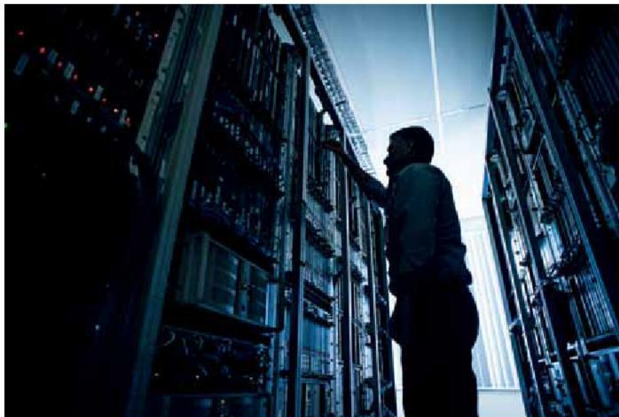
1 Laboratório de testes da empresa Trópico, em Campinas: setor privado quer reverter vetos na legislação, como os relacionados a bolsas