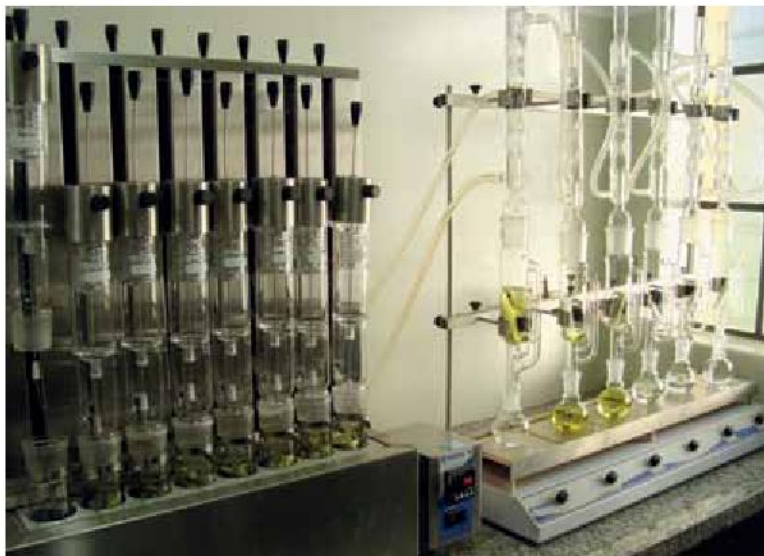
Laboratório de Nutrição Animal da Secretaria de Agricultura de São Paulo: compartilhamento de infraestrutura de pesquisa é estimulado