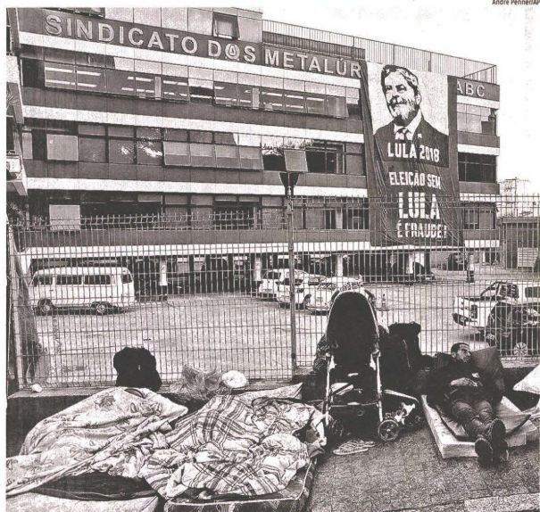
Milicianos dormem em frente ao prédio do Sindicato dos Metalúrgicos do ABC, em São Bernardo do Campo, ontem de manhã, em vigília pelo ex-presidente Lula

O atual edifício, na rua João Basso, foi entregue em 6 de outubro de 1973 para "o bem-estar político e social da família metalúrgica", como dizia a placa de seu can-