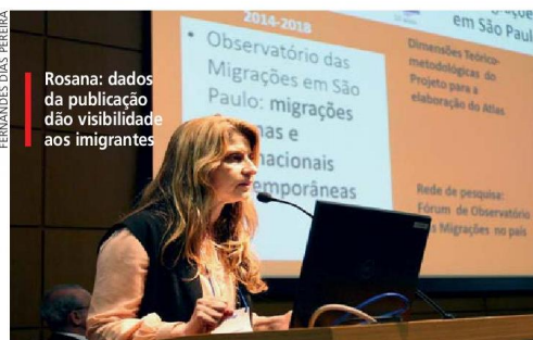
Rosana: dados da publicação dão visibilidade aos imigrantes

SERVIÇO Mais informações: https://goo.gl/QUFFEm