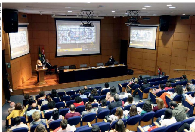
Lançamento na Fapesp: imigrações mais concentradas no hemisfério Sul