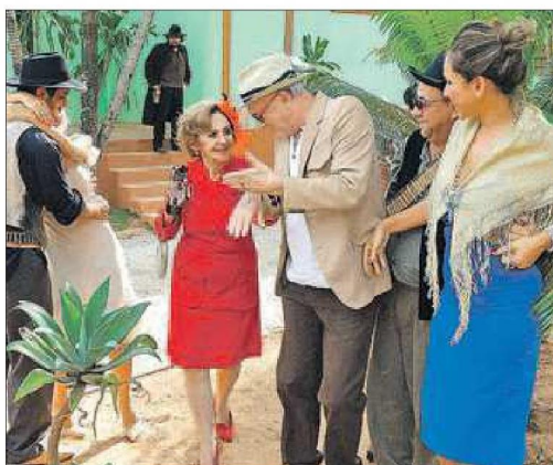
Laura Cardoso faz uma cafetina como em O Outro Lado do Paraíso