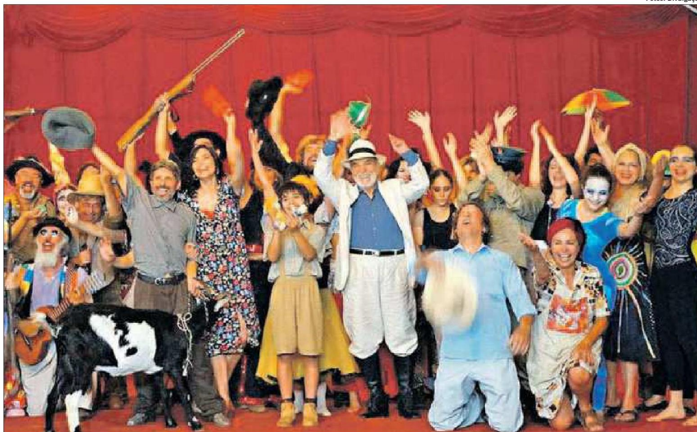
Elenco reúne grandes nomes da dramaturgia brasileira, entre eles, Lima Duarte (centro de chapéu) que interpreta o mandão coronel Terso