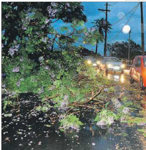
Árvore foi derrubada pelo temporal na Avenida Moraes Salles