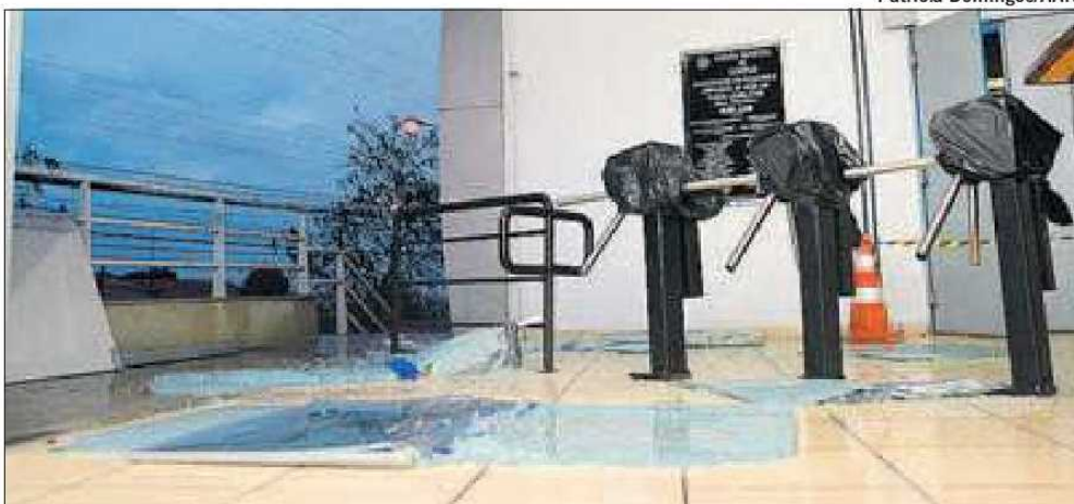
Vidro estilhaçado perto das catracas que controlam acesso ao Legislativo: prejuízo