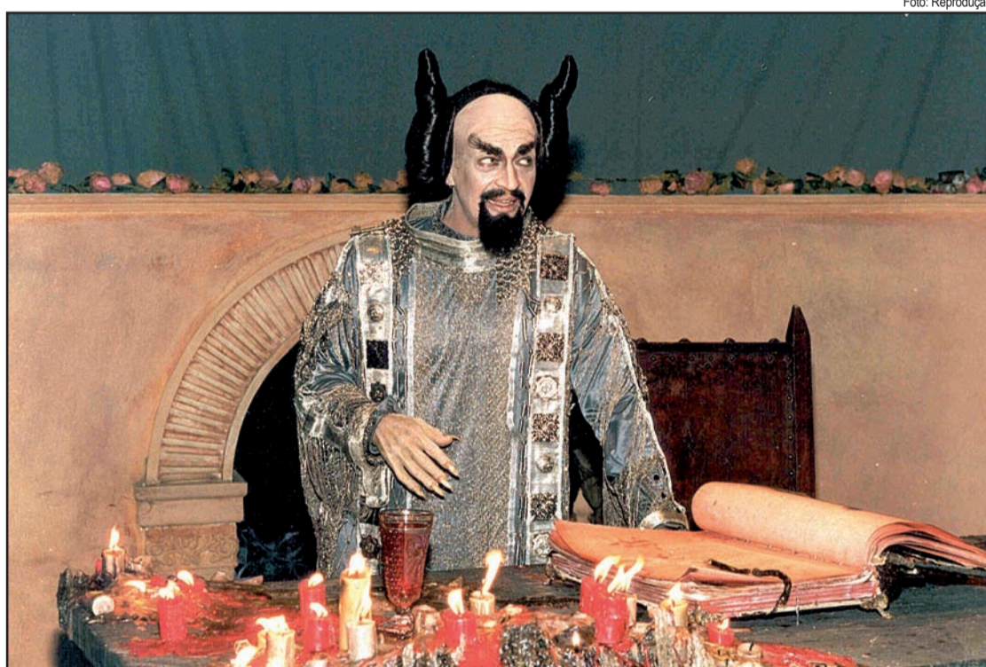
Cena do filme “Auto da Compadecida”, baseado na obra homônima de Ariano Suassuna: fusão de elementos

Mas, antes de trazer à tona o teatro popular italiano, a pesquisadora foi buscar as origens das personagens na dramaturgia romana de Terêncio e Plauto (230 a. C. 180 a. C.), especialmente Plauto. A temática dos irmãos gêmeos separados na infância de Os Dois Menecmos é recuperada por Shakespeare em A Comédia dos Erros , assim como Aulularia ou A Comédia da Panela , serve de inspiração