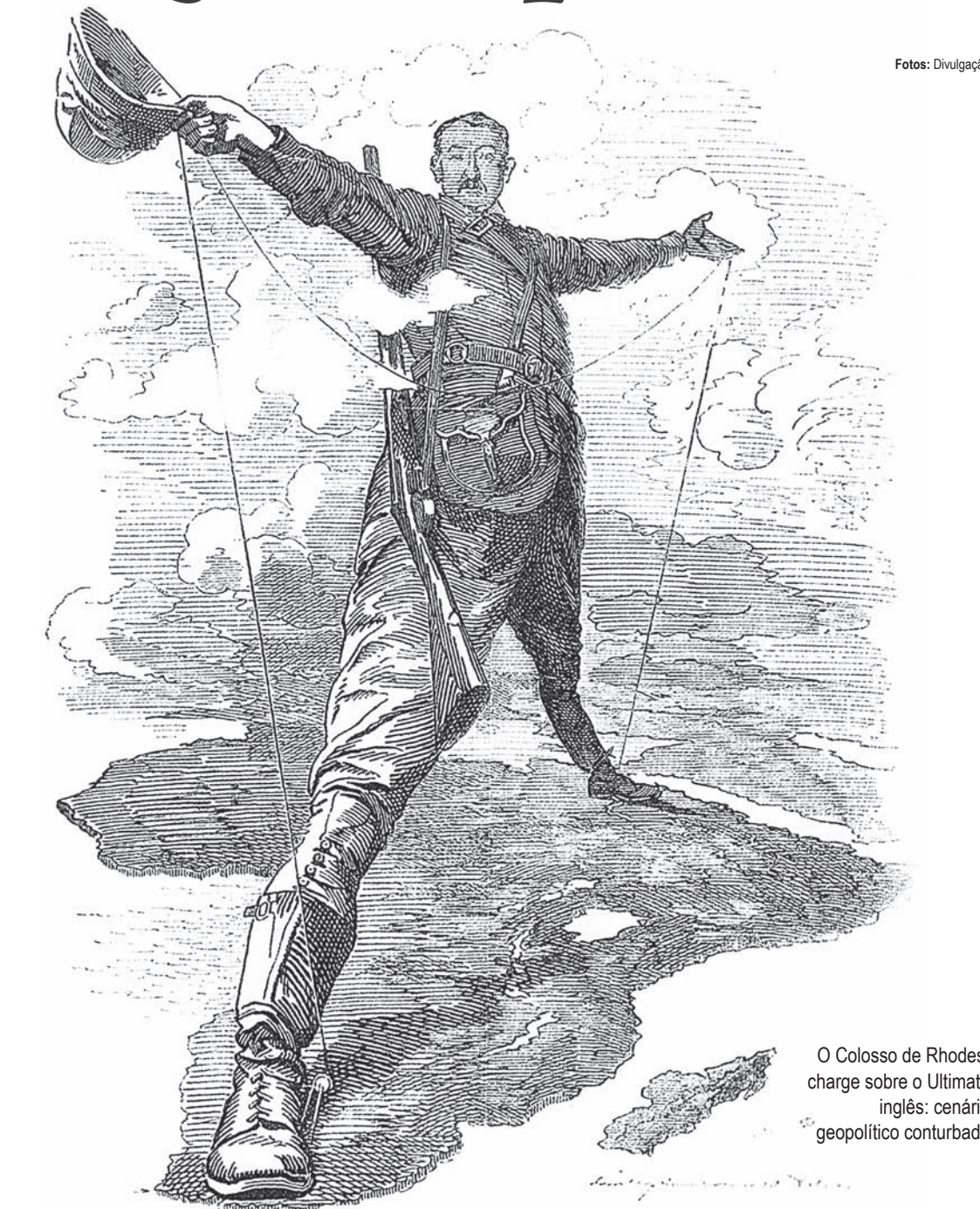
O Colosso de Rhodes, charge sobre o Ultimatum inglês: cenário geopolítico conturbado

Berriel – Isso é o modernismo paulista de Paulo Prado. Cada autor deverá ser estudado em si mesmo, e as similitudes e diferenças com o pensamento de Paulo Prado naturalmente aparecerão. Só temos a ganhar com isso.