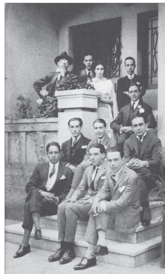
Na Villa Fortunata: Mário de Andrade (primeiro à esq., no alto) e outros modernistas em 1922