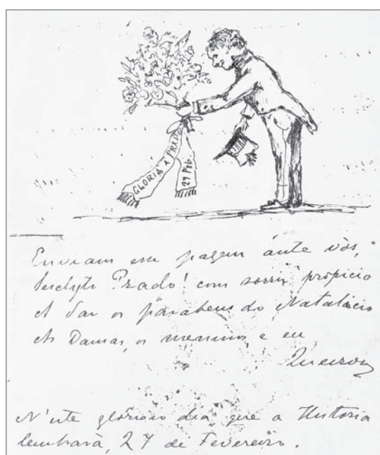
Bilhete autografado de Eça de Queirós para Eduardo Prado: intelectuais portugueses influenciaram cafeicultores

JU – Retrato do Brasil faz um diagnóstico dos problemas brasileiros que parece muito atual: corrupção, incompetência, ineficiência... Paulo Prado acertou o problema, mas errou a causa?