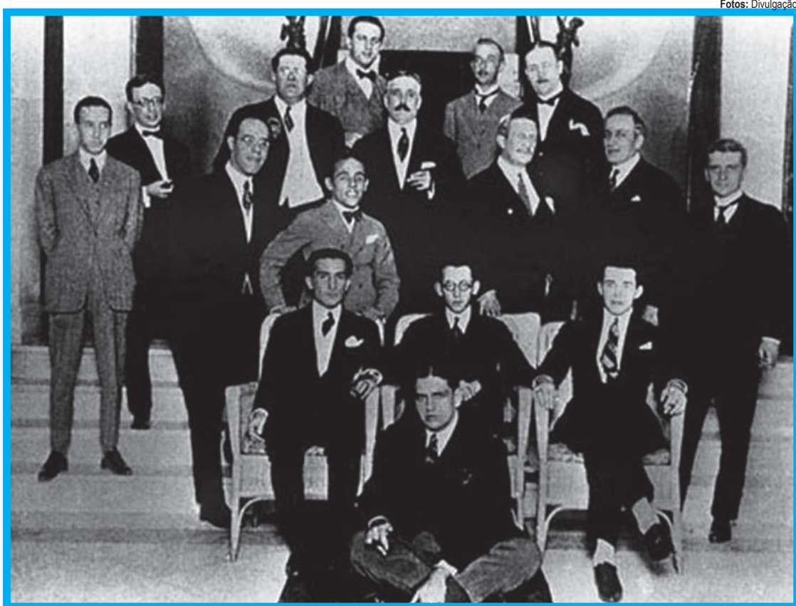
Paulo Prado (centro) ladeado por intelectuais da Semana de Arte Moderna

Essa construção, bastante – digamos – poética e livre de Paulo Prado, serve como diagnóstico que é lido com respeito por muita gente, lido como verdade. Paulo Prado chega a dizer que o paulista já é uma raça. Então, temos no Brasil uma raça superior e uma raça inferior. E o Estado brasileiro deveria seguir essa lógica. Esse paulista é o único capaz de produzir uma arte autêntica – a modernista –, enquanto o brasileiro resta no romantismo, no parnasianismo, etc.