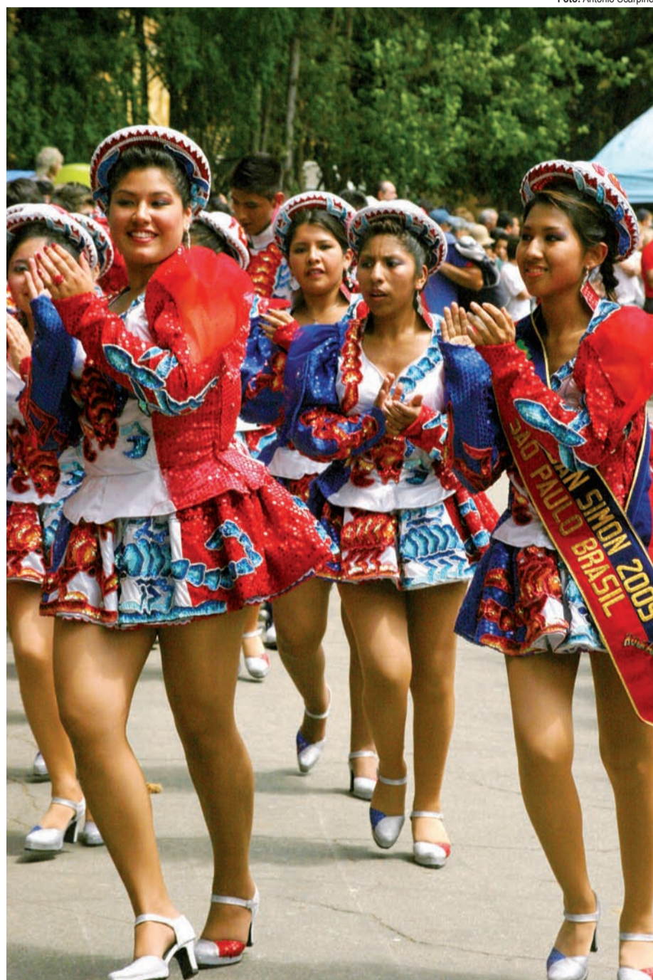
Apresentação de dança típica boliviana em São Paulo: novos fluxos de imigrantes reavivaram preconceitos