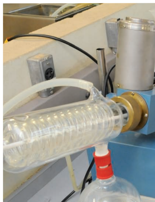
Tábata Tayara Garmus, autora do estudo: método mostrou-se eficiente na extração de compostos (no destaque) bioativos das matrizes vegetais