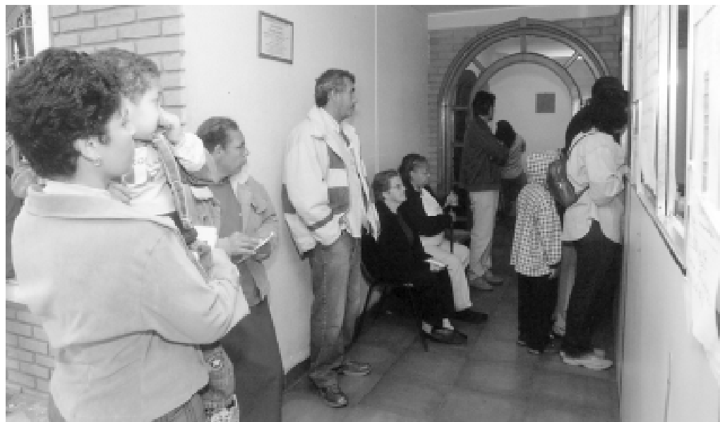
Usuários de centro de saúde em Campinas: pesquisador prevê aumento da sobrecarga nos hospitais universitários e nos postos de municípios maiores