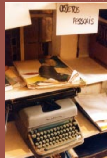
Máquina de escrever de Biondi