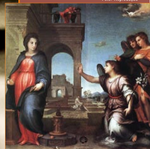
Obra de arte do acervo do Vaticano