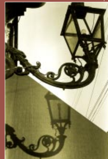
Poste na região central de Campinas