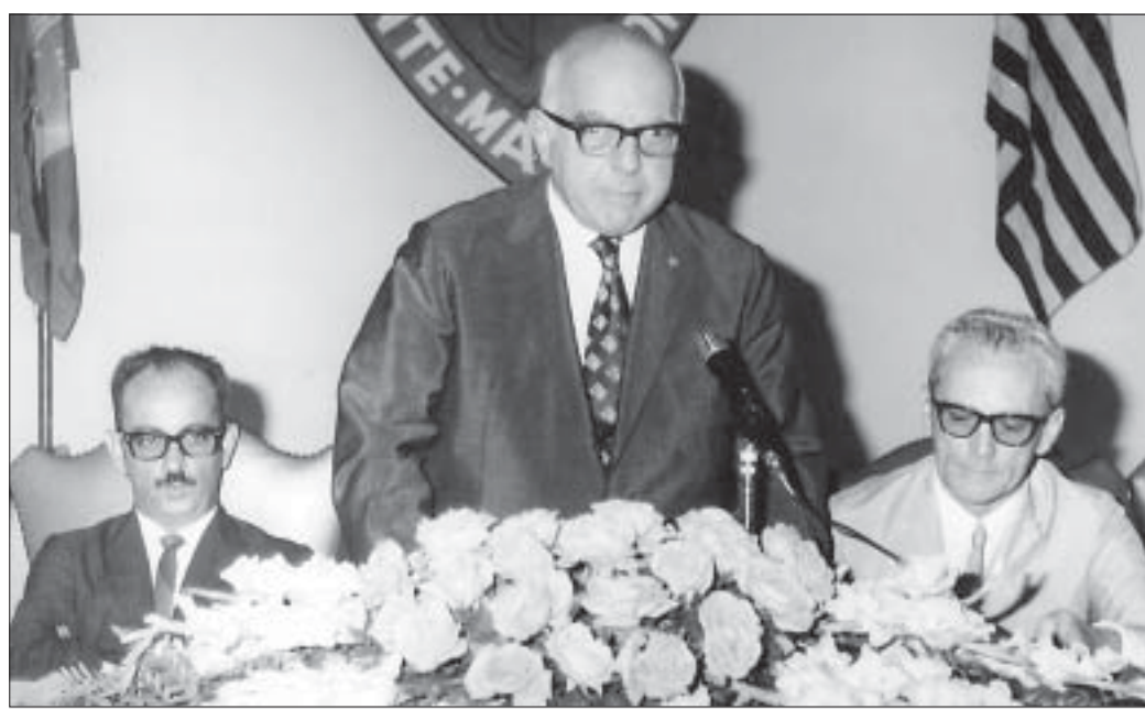
O geneticista Friedrich Gustav Brieger em aula inaugural na Faculdade de Odontologia de Piracicaba em abril de 1971