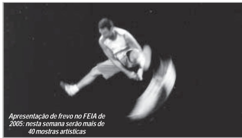
Apresentação de frevo no FEIA de 2005: nesta semana serão mais de 40 mostras artísticas