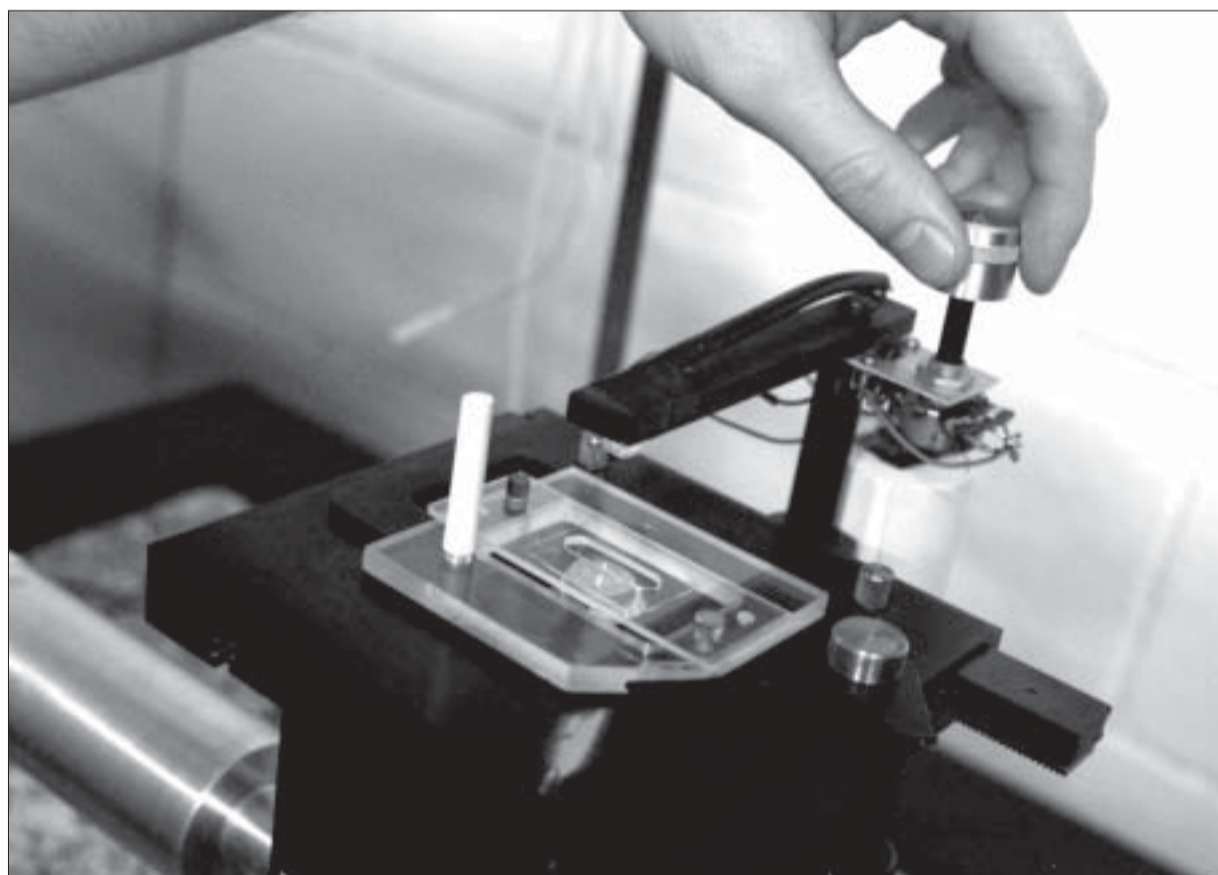
Detalhe do dispositivo que permite determinar a concentração de cálcio nas células do músculo cardíaco

FEEC, desenvolveu um instrumento simplificado de microfluorimetria que permite quantificar de forma simultânea, em células cardíacas isoladas, o curso temporal da concentração de cálcio e o encurtamento celular (isto é, a contração da célula). Para tanto, ele utilizou um indicador de Ca^{2+} que, uma vez no interior da célula e sob excitação luminosa adequada, emite luz cuja intensidade está relacionada com a concentração do íon nas células.