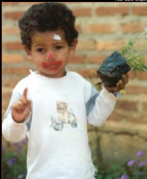
Criança da Amic e o não à fome. Págs. 8 e 9