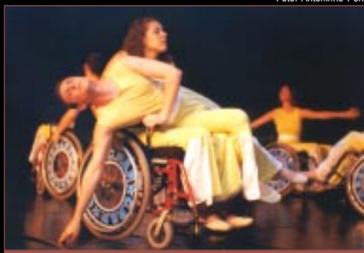
Dançando sobre cadeira de rodas. Pág. 19