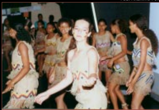
Show da comunidade saudável. Págs. 3 a 5